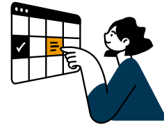
Termine sind auch einzeln buchbar