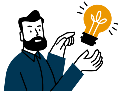
Beleuchtung eines Schwerpunktthemas